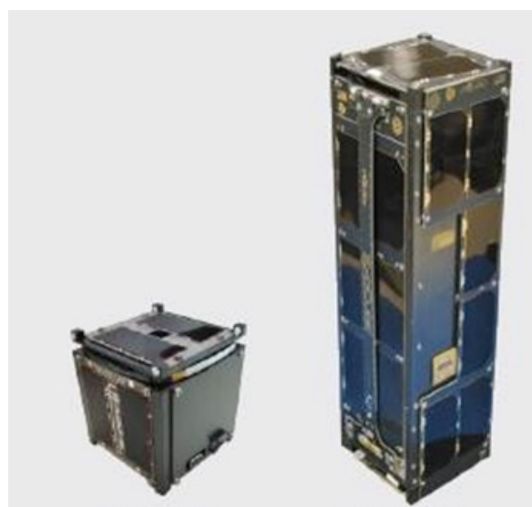
Figura 2. CubeSat CPI 1U y CubeSat 3U CP10

En los años transcurridos desde el inicio del CubeSat, los tamaños más grandes se han vuelto populares, como 1.5U, 2U, 3U, 6U y 12U. En la FIGURA 2 se muestran ejemplos de 1U y 3U.