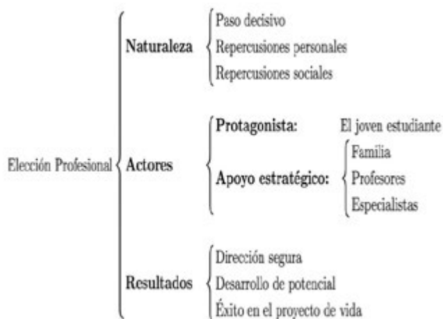
Gráfico 1. El proceso de la elección profesional.

Definir el camino profesional constituye un paso decisivo con importantes repercusiones personales y sociales. En este proceso, los jóvenes estudiantes se configuran como los actores centrales, donde el apoyo estratégico del entorno familiar, docente y de especialistas resulta fundamental, tal como se esquematiza en el Gráfico 1. Este acompañamiento favorece que el estudiante tome decisiones más seguras, desarrolle plenamente su potencial y se comprometa con su proyecto de vida, fortaleciendo sus competencias tanto en el ámbito académico como en su futura proyección profesional (Calero Torres, 2022).