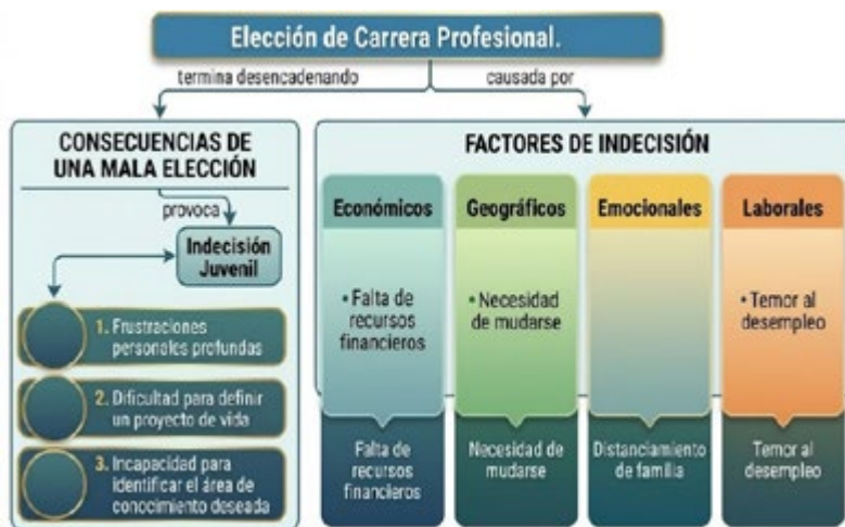
Gráfico 3. Factores de indecisión y consecuencias de una mala elección.

tal como se esquematiza en el Gráfico 3. Entre los factores más recurrentes se encuentran las limitaciones económicas, el cambio de residencia, la separación del núcleo familiar, la incertidumbre laboral y el distanciamiento del entorno social y de los amigos. (Montero, 2000).