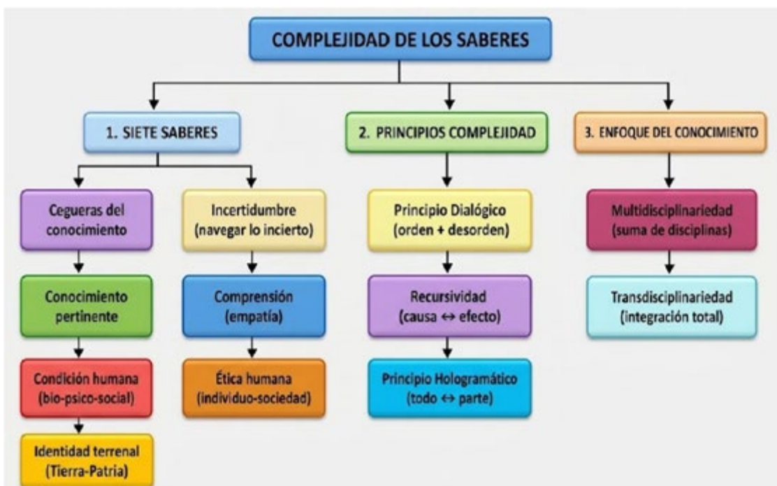
Gráfico 4. Articulación de la complejidad de los saberes complejos

La necesidad de articular diversos saberes, disciplinas, niveles de análisis y dimensiones humanas para comprender y actuar sobre la realidad es planteada por Morin, quien además considera los siete saberes como pilares fundamentales de la educación moderna. Estas articulaciones se esquematizan en el Gráfico 4.